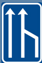
IP 18B: snížení počtu jízdních pruhů

Řidič jedoucí v průběžném jízdním pruhu je povinen dát přednost řidiči prvního vozidla v jízdním pruhu s překážkou, pokud dává znamení o změně směru jízdy. Platí, že řidič jedoucí do průběžného pruhu nemůže ohrozit řidiče v průběžném jízdním pruhu.