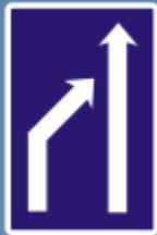
C 22b: zúženie počtu jazdných pruhov

Vodič idúci v priebežnom jazdnom pruhu je povinný umožniť vodičovi prvého vozidla v jazdnom pruhu s prekážkou, ak dáva znamenie o zmene smeru jazdy. Platí, že vodič idúci do priebežného pruhu nemôže ohroziť vodiča v priebežnom jazdnom pruhu.